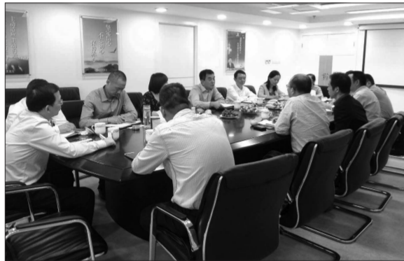
11月2日下午兴业银行福州分行、华福证券福州分公司、兴业期货福州营业部集团业务联动座谈会

在“第九届中国最佳期货经营机构暨最佳期货分析师评选”活动中,兴业期货凭借快速的业务增长态势、规范的风控机制、较强的盈利能力,以及在服务大宗商品产业客户方面的突出表现,一举斩获“中国最具成长性期货公司”“最佳商品期货产业服务奖”等多个奖项,同时其上海分公司也蝉联“中国优秀期货营业部”。近年来,通过与集团内机构的合作联动,兴业期货业务取得了快速发展,公司产业客户服务能力也大幅提高。