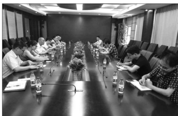
2016年7月22日,兴业期货研究咨询部、杭州营业部会同兴业银行向浙江物产化工集团介绍仓贸通业务